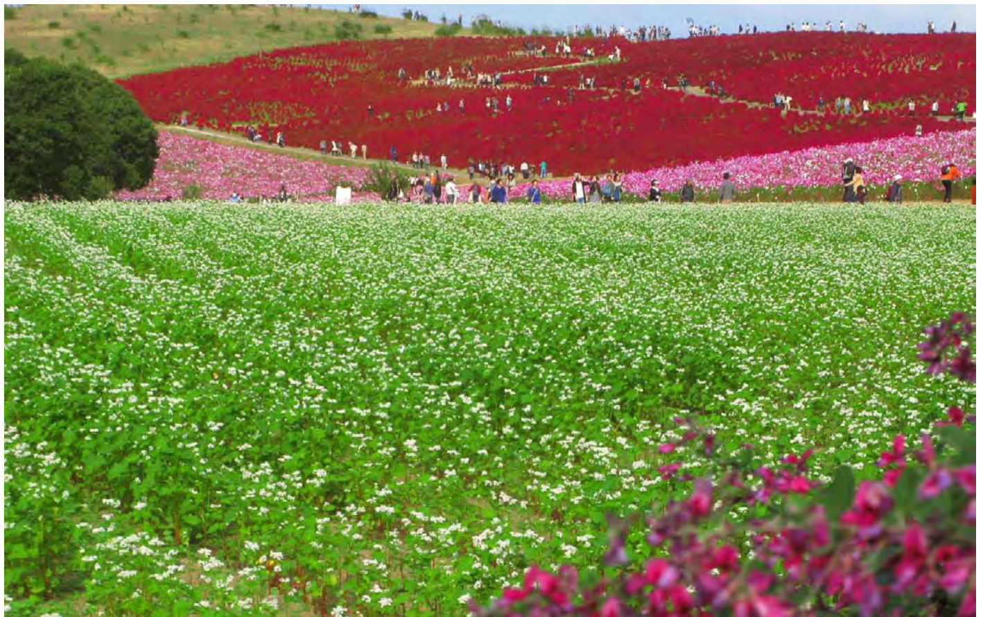
ハギ・ソバ・コスモス・紅葉のコキア ひたち海浜公園