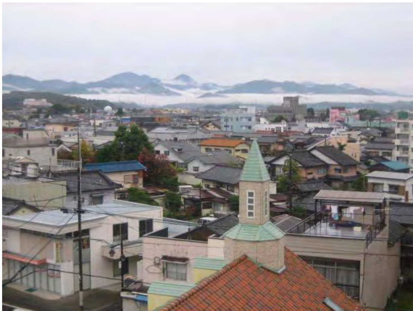
藤岡市第一ホテルより秩父連山を望む