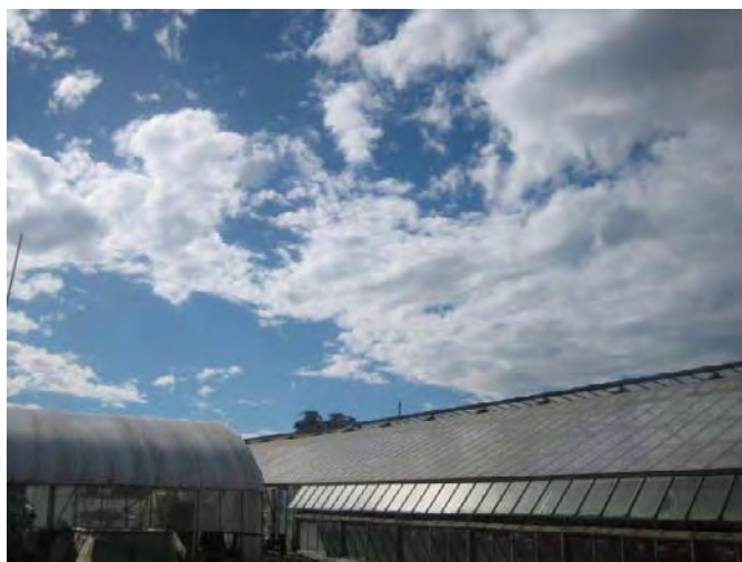
シクラメンハウスの秋