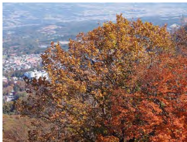
榛名山・山頂より伊香保の街を望む。 富士山の姿も見ることが出来ました。