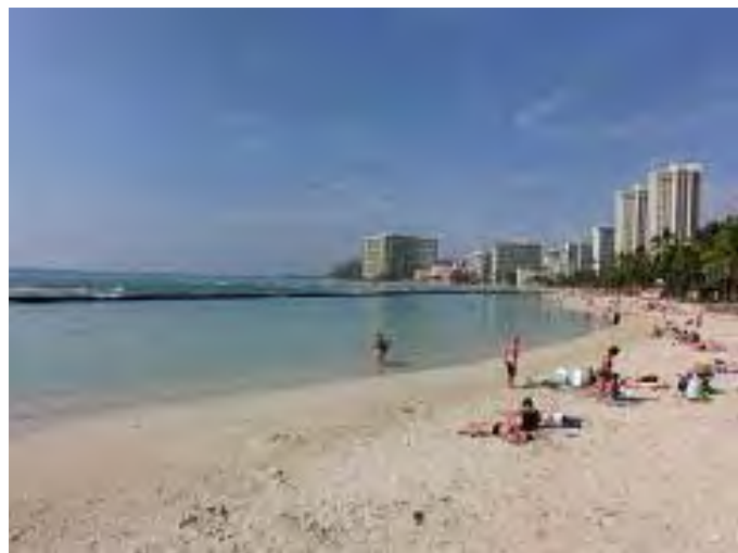
ワイキキ・ビーチ