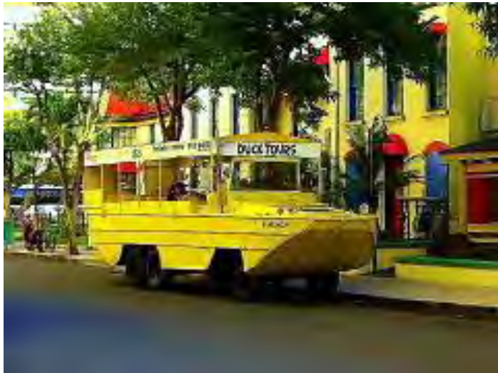
第二次大戦使用された水陸両用車