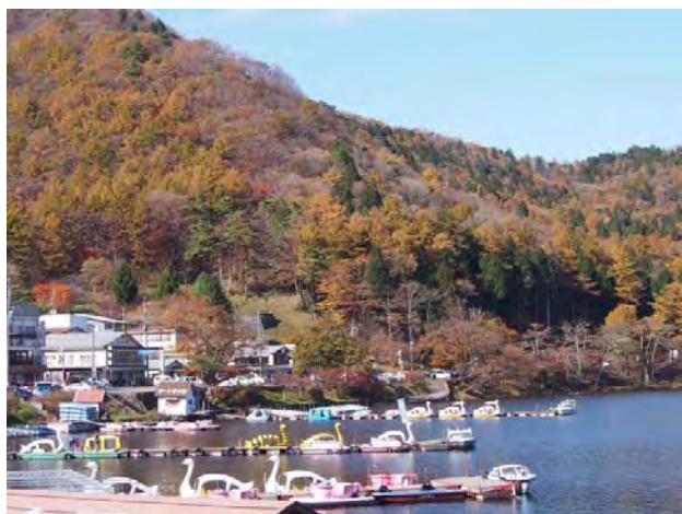
榛名湖・湖畔の風景