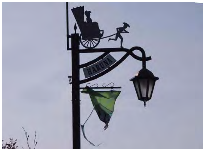
榛名湖・湖畔の街路灯