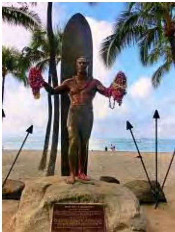
サーフィンの神様 デューク・カハナモーク